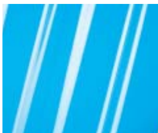
Film transparent sans eau visible