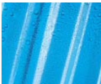
Apparition d'une couche transparente (ou opaque) de gouttes d'eau